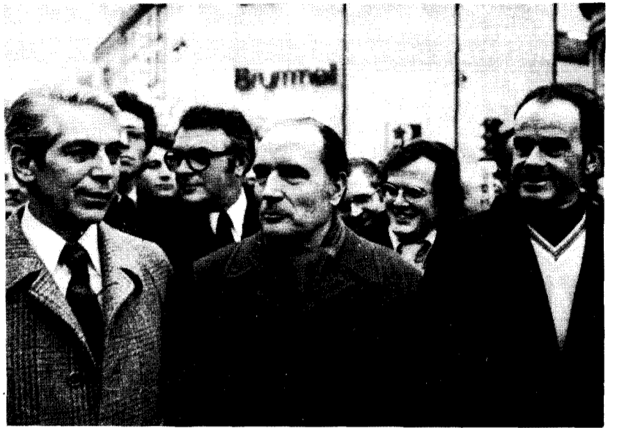
Mitterrand, Marchais et Fabre dans l'union de la gauche : l'unité qu'ils regrettent

L'OCI et la LCI n'ont en aucune façon la prétention d'avoir un programme pour la révolution prolétarienne ; leur politique, axée sur le Parlement bourgeois, dirige tous leurs efforts pour instaurer un gouvernement parlementaire PC-PS, présenté sans autres ambages comme "la seule ouverture politique qui respecte la démocratie" ( Informations Ouvrières n° 930). Elles ne vivent qu'au rythme des sessions parlementaires (Cf. la manifestation devant le Parlement le 30 mai, qui devait être le jour du vote de la loi Berger) et des campagnes électorales. Elles sont déjà mobilisées sur l'horizon 81. Crétinisme électoral oblige, l'OCI, rejointe par la LCI, a été la première à mener campagne, et plus d'un an avant les élections présidentielles, pour le désistement du PC et