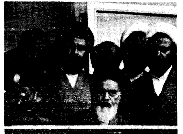
Téhéran, le 4 Mai Khomeiny et son fils assistent à un rassemblement de mollahs dûment armés

colonial était réellement meurtrier. La réponse des marxistes doit être sans ambiguïté : USA, bas les pattes devant l'Iran ! Sans donner le moindre soupçon de soutien politique au régime réactionnaire islamique du fanatique religieux Khomeiny, nous sommes du côté des mollahs cinglés contre Carter, le fauteur de guerre impérialiste.