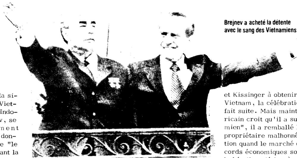
Brejnev a acheté la détente avec le sang des Vietnamiens

En juin 1973, quelques mois seulement après la signature des accords de "paix" de Paris sur le Vietnam et le retrait des troupes américaines d'Indochine, le dirigeant soviétique, Leonid Brejnev, se rendait à Washington pour claironner l'avènement d'une nouvelle ère baptisée "détente". Avant de donner l'accolade à Richard Nixon, il déclara que "le quart de siècle de la guerre froide cède maintenant la place à des relations de paix, de respect mutuel et de coopération entre les Etats de l'Est et de l'Ouest". En réponse à cette célébration par Nixon et Brejnev d'"une génération de paix", nous avons écrit un article "U.S./USSR Détente Doomed" ["La détente USA/URSS est vouée à l'échec"] paru dans Workers Vanguard n° 24, 6 juillet 1973. Nous posons la question aujourd'hui : qui avait raison, Brejnev ou les trotskystes ?