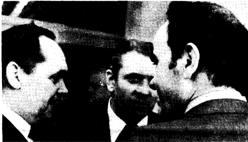
Marchais avec Werblan du Parti ouvrier polonais à la "rencontre des PC d'Europe pour la paix et le désarmement" le 29 avril: recherche obstinée de la détente en dépit de tout

Le fait que les démocrates-chrétiens étaient davantage prêts à accepter la division de l'Allemagne