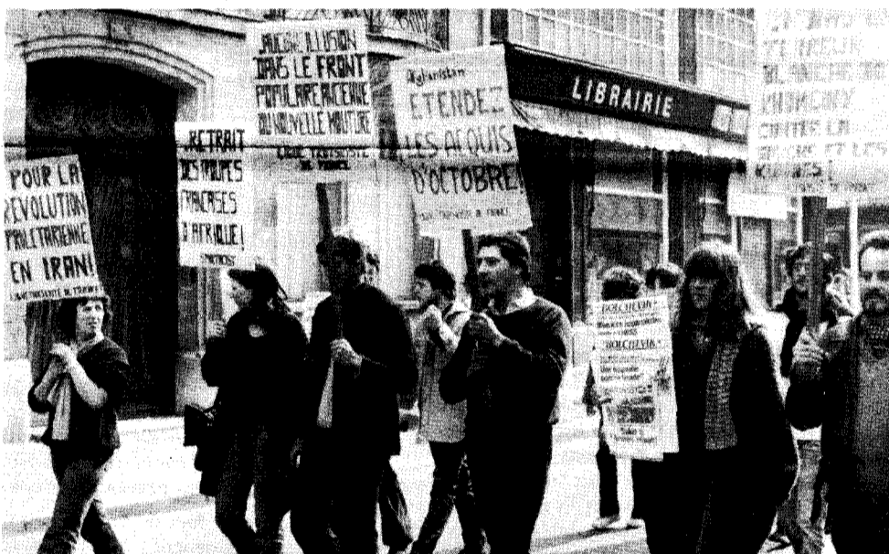
La LTF à la manifestation du 1er mai à Rouen